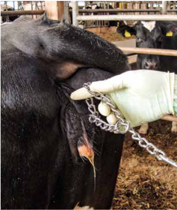
Verletzungen der Scheide oder des Hymenalringes entstehen durch unsachgemäße Geburtshilfe.

Zervix und Vagina werden bei einer natürlichen Kalbung gedehnt, aber nicht verletzt. Risse und Quetschungen entstehen in der Regel durch unsachgemäße Geburtshilfe.